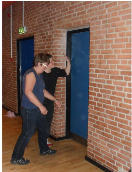
...blev kastet ind i døren så det sagde BANG og råbt højt av!