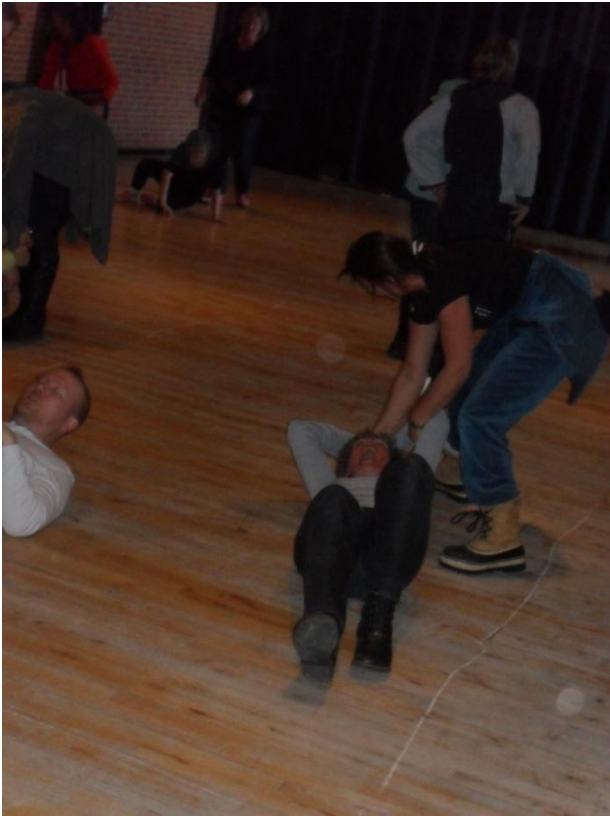
De rykkede hinanden i håret...