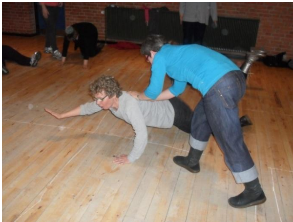
Vende hinanden op – kaldt vend pandekagen!